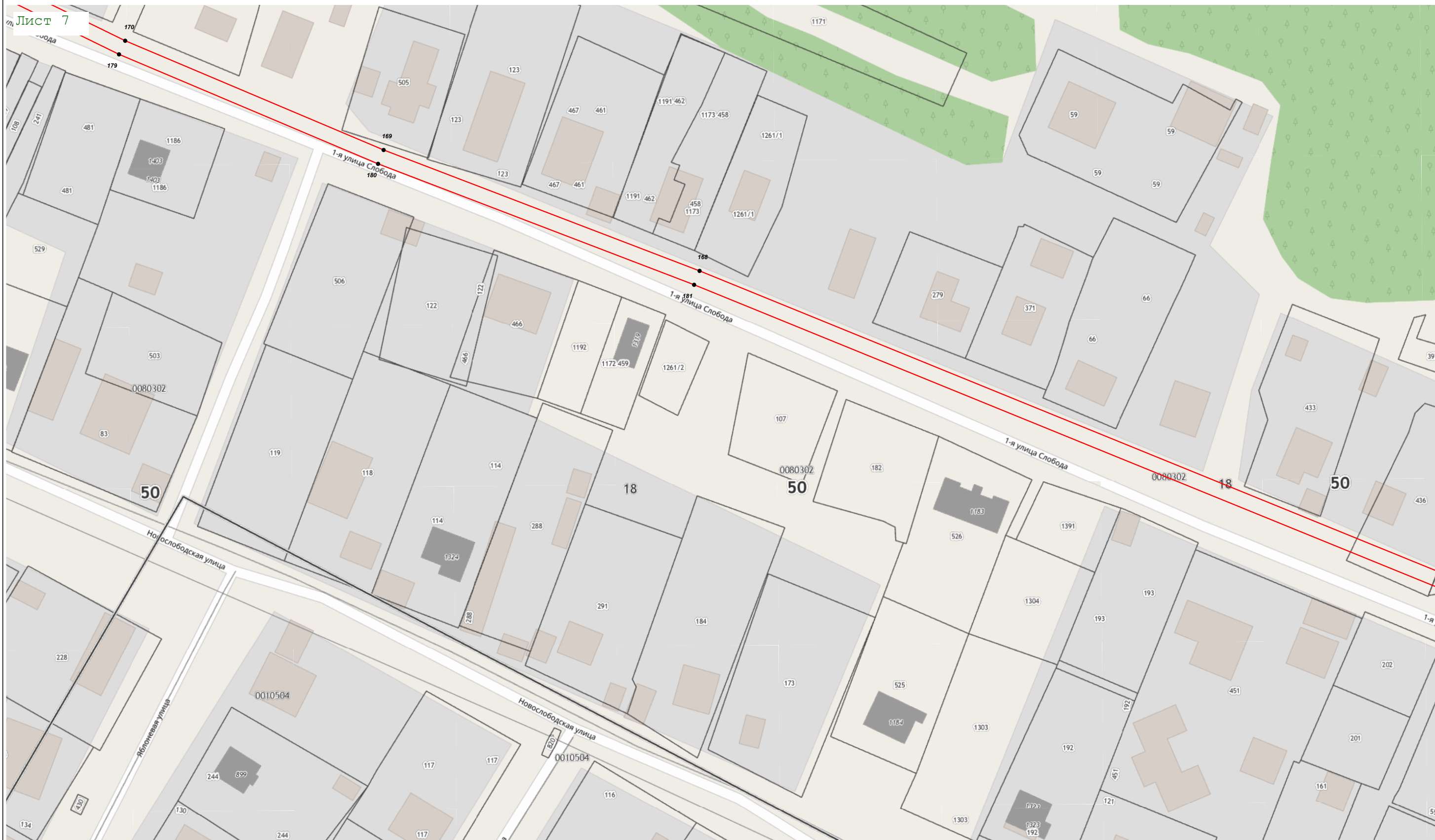
Масштаб 1:1 000